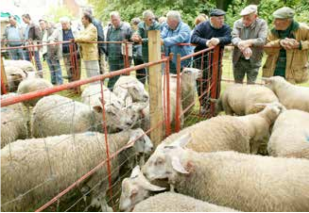
Les béliers à vendre