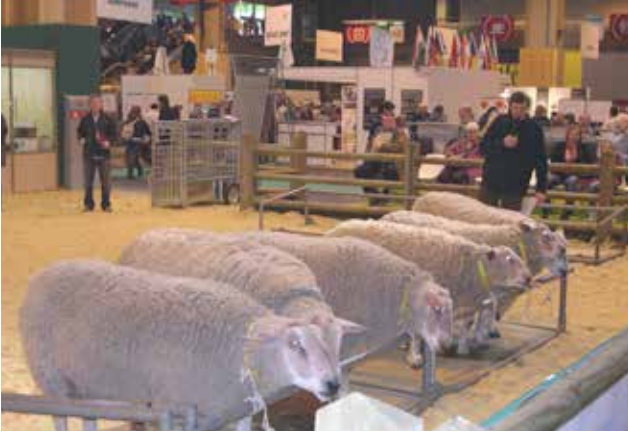
Commentaires de René STIEVENARD sur le classement des béliers