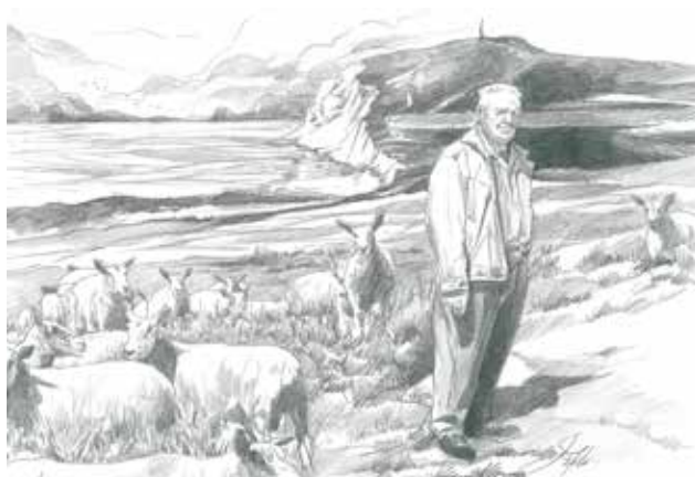
Dessin de Bruno GHYS (réalisé pour l'occasion)