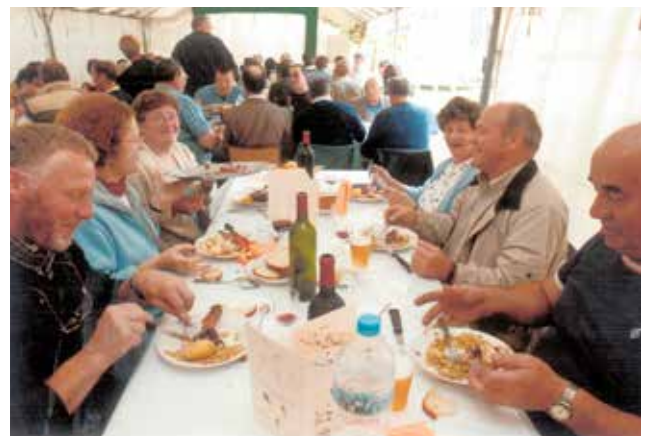
... et dégustation de viande Boulonnaise