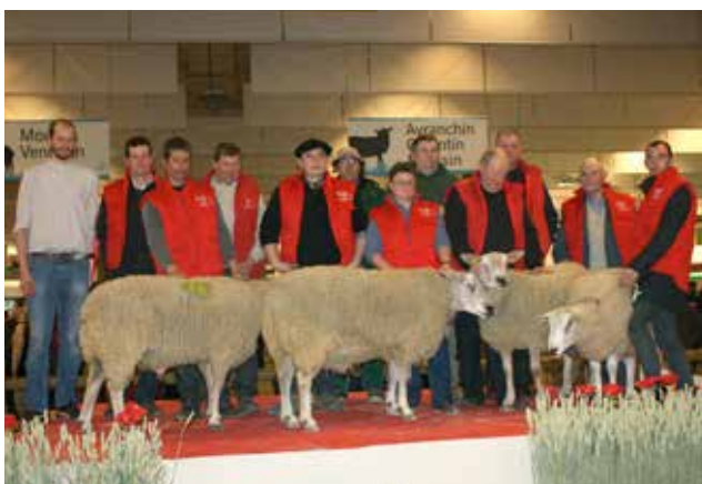
Reproducteurs primés au Salon international de l'agriculture de Paris