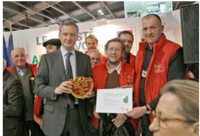
Remise du prix par Bruno LEMAIRE, Ministre de l'agriculture, au Salon de l'agriculture