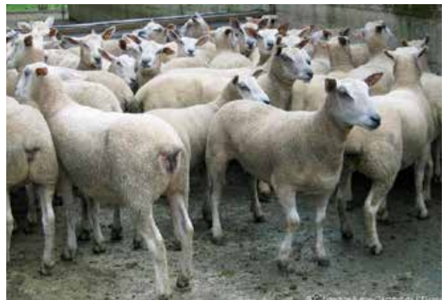
et un lot de femelles présentées à la commission