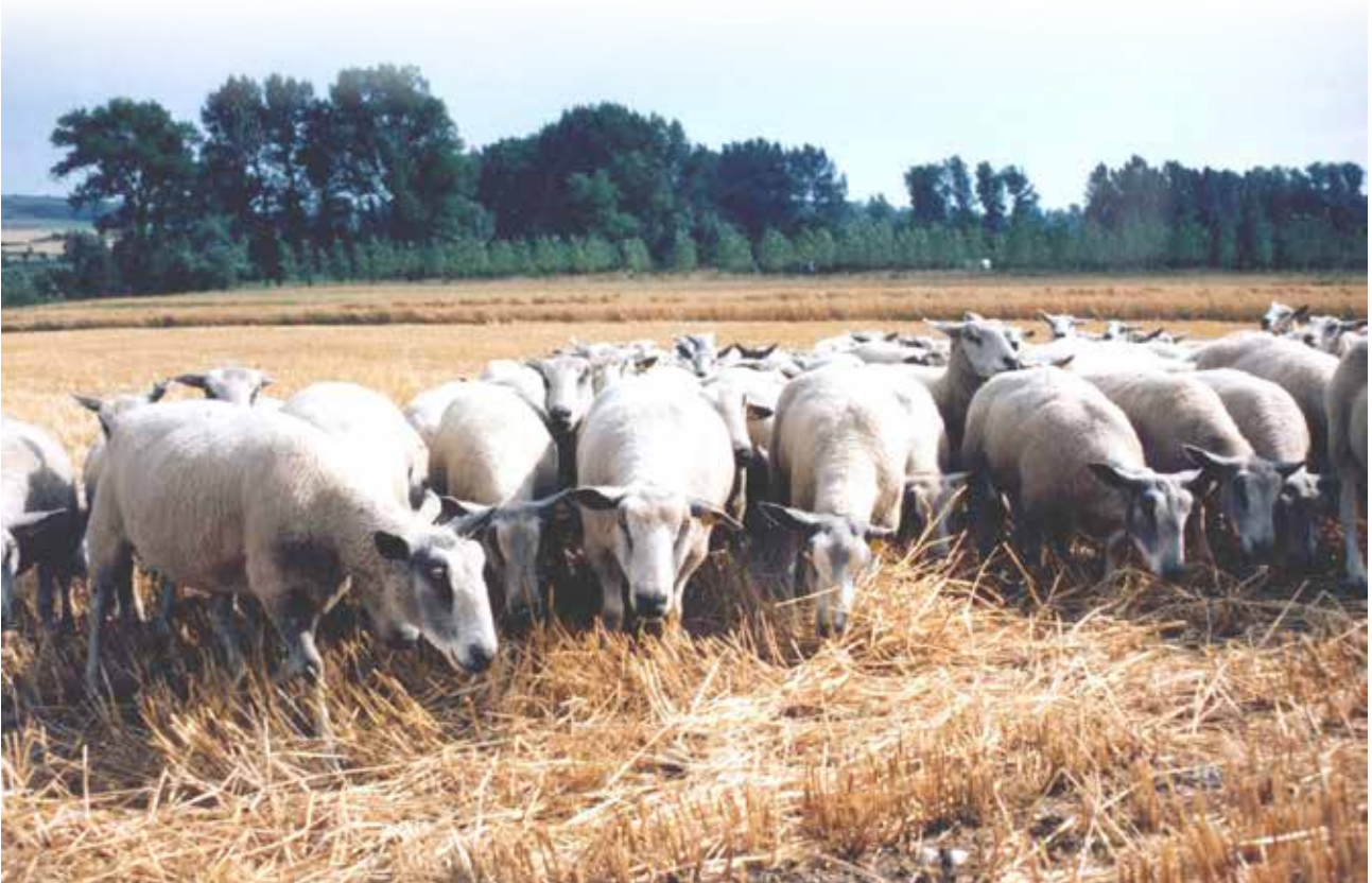
Troupeau de Michel GALLET de Coyecques (62) pâturant dans les chaumes