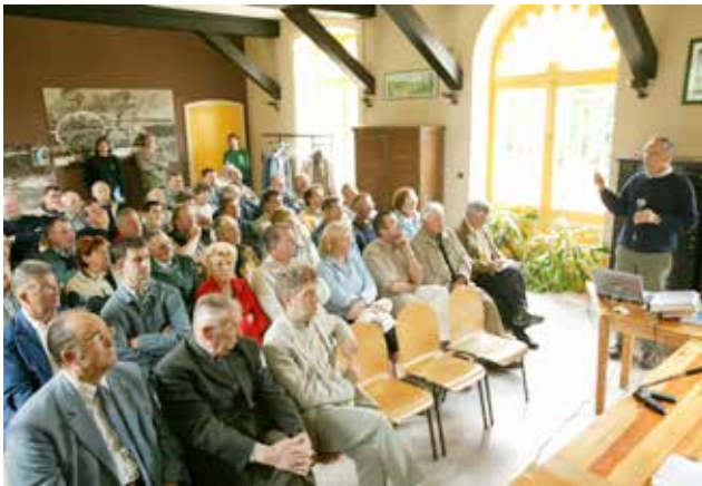
Présentation de la race et de son histoire