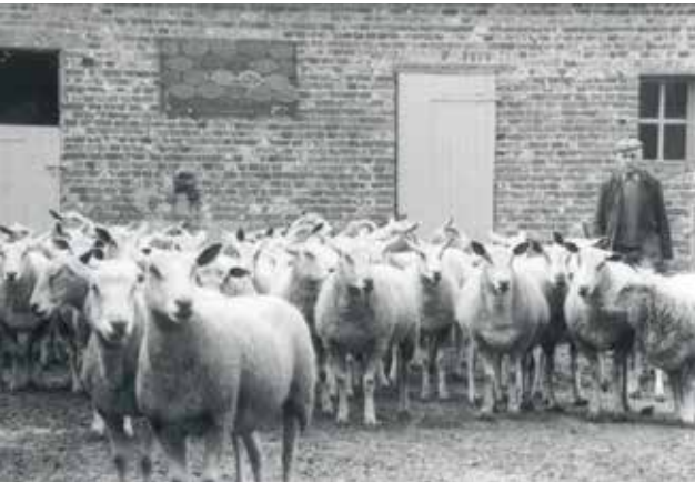
Elevage de Marcel LASSALLE – Elnes (62)