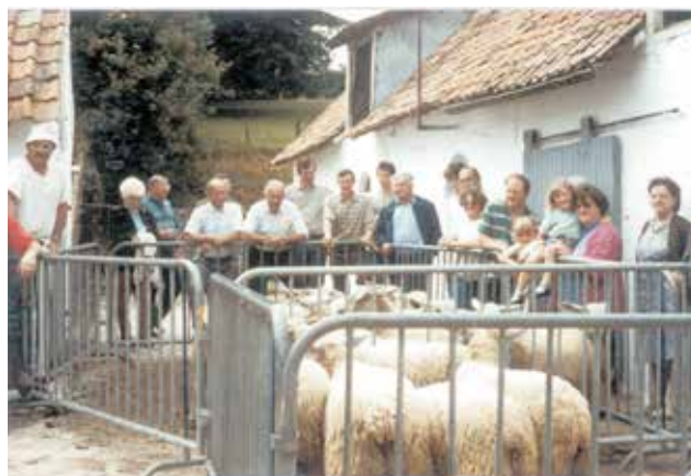
et les éleveurs