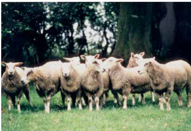
Groupe de béliers élevés au centre d'élevage de Doudeauville