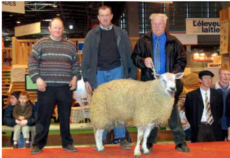
Salon de l'agriculture de Paris