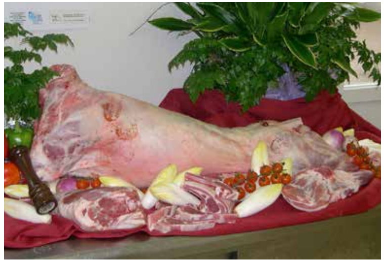
Carcasse de Boulonnaise