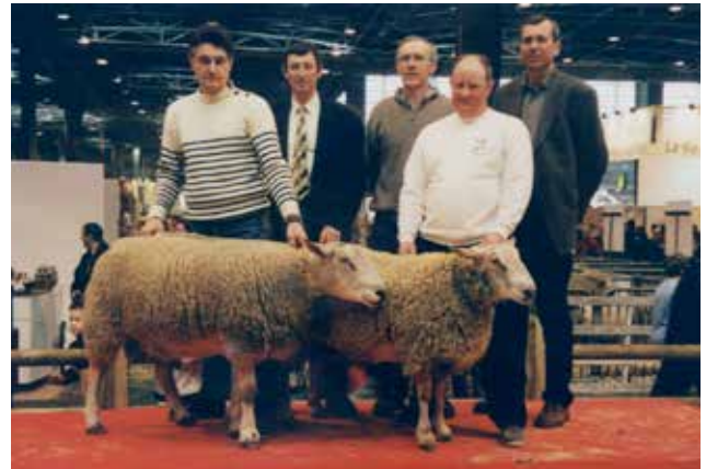
Salon de l'agriculture de Paris : le podium