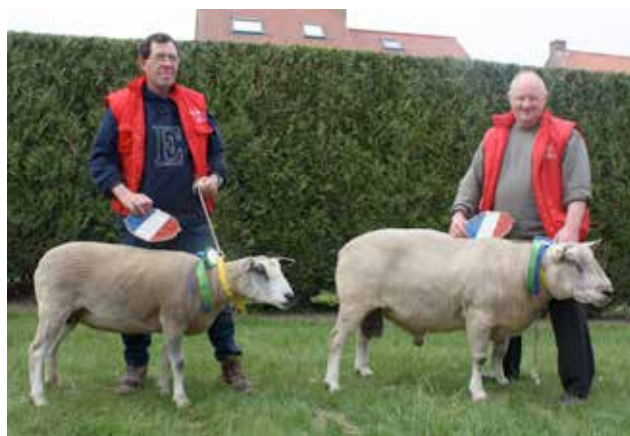
Concours spécial lors de la Mei-Feest de Steenvoorde (59)