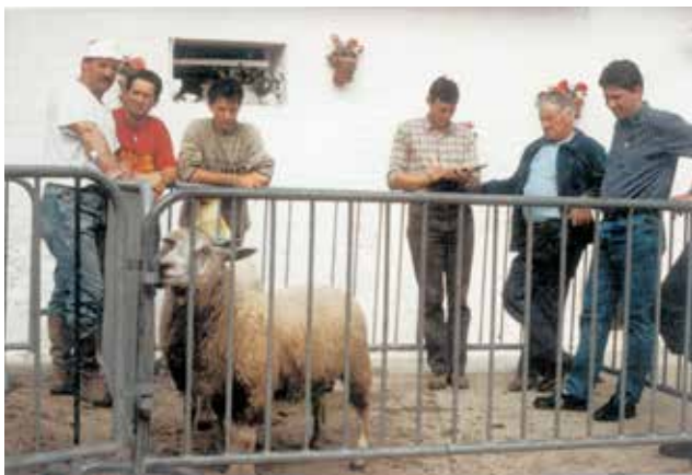
Pointage des béliers au centre d'élevage