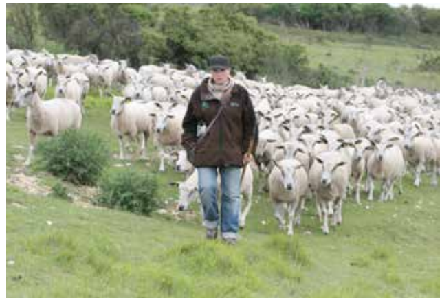
Le troupeau en parcours sur le Cap Blanc Nez