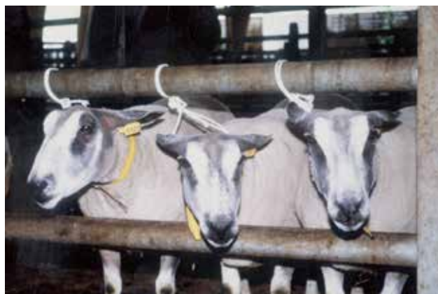
Lot de trois brebis de l'élevage d'André ROUSSEL à Moufflers (80)