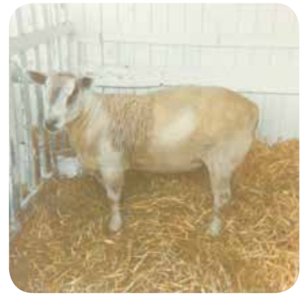
Lots de trois brebis Boulonnaises de l'élevage d'André ROUSSEL de Moufflers (80) en concours dans la Somme en juillet 1964 ainsi qu'un bélier Boulonnais