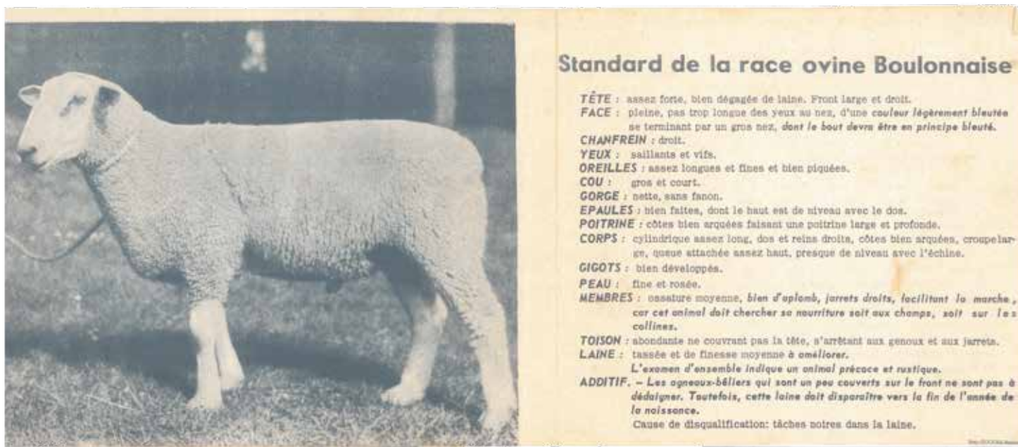
Standard de la race dans les années 60

La Boulonnaise a fait ses preuves en matière de gestion des milieux naturels : en 2014 on peut la trouver sur 23 sites gérés par Eden 62, le Conservatoire d'espaces naturels du Nord-Pas de Calais et le Parc naturel régional des Caps et Marais d'Opale. Ce sont au total près de 800 brebis Boulonnaises qui entretiennent 500 hectares de coteaux calcaires et autres sites naturels du Boulonnais et du Haut Pays.