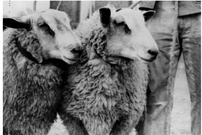
Deux beaux types Boulonnais de Maurice GAMBET de Grébault-Mesnil (80)