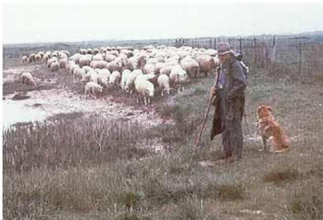
Jean HENOCQUE de Woignarue (80) en parcours sur les prés salés