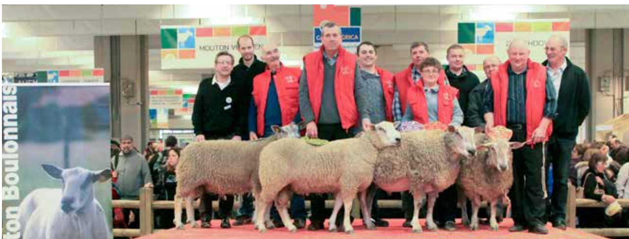
Reproducteurs primés au Salon international de l'agriculture de Paris