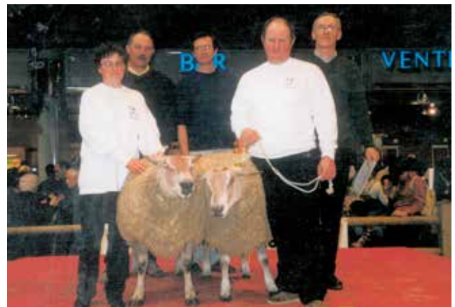
Le podium du concours de béliers