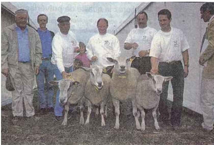
Les animaux primés