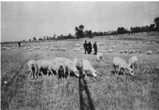
Le troupeau de Maurice GAMBET de Grébault-Mesnil (80)