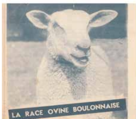
Prospectus des années 1960

FLOCK - BOOK DE LA RACE OVINE BOULONNAISE