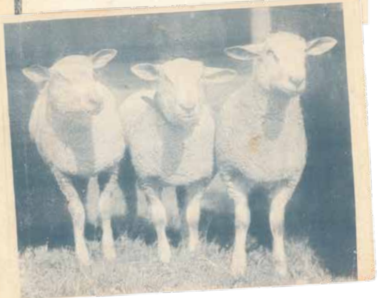
Origines de la race

Occupant la totalité du département du Pas-de-Calais et la partie nord du département de la Somme, où elle se trouve en concurrence avec la race Ile-de-France qui en occupe la partie sud, la race ovine possède comme berceau d'origine les régions de Montreuil-sur-Mer, Hesdin et Marquise dans le Pas-de-Calais et les environs de Crècy dans la Somme. A l'heure actuelle, les meilleurs troupeaux s'échelonnent sur une ligne partant de Boulogne, Montreuil, Rue, Abbeville, Amiens.